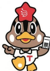
館林選挙マスコット 『とうひょうくん』